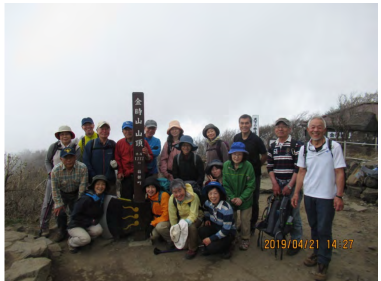
(金時山山頂で全員集合)

このコースは駅から金時山に登れるルートで距離は長いけどほとんどが緩やかな登りであり、歩く人も少ないので静かな山歩きが出来るルートである。交通トラブルで予定より大幅に遅れてしまった仙石原からの先発、後発のメンバーと合流し全員で写真撮影後、足柄駅方面と仙石原方面に分かれて下山。