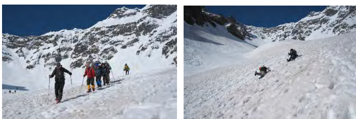
《吊尾根をバックに澗沢を下る》 《本番の後の滑落停止の自主練》

8時05分南岳の先が見えた。ピッケルでの滑落停止を自主練しながら、降りる。サクサクッとアイゼンで雪の上を歩く音が耳に心地よい。