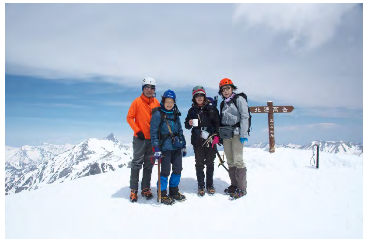
《槍をバックに北穂頂上。前穂～奥穂、笠、薬師、鹿島槍等360°の展望》

10時50分北穂頂上。奥穂から南西方向に馬の背、ろばの耳、ジャングルムの稜線が。振り返ると槍ヶ岳、笠ヶ岳、後立山連峰の双耳峰鹿島槍が雲ひとつない青空にくっきりと浮かんで見えた。360度の素晴らしい絶景に登って来る時の苦しさが吹き飛んだ。