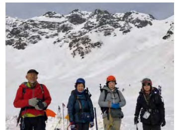
《北穂沢から北穂へのルート》