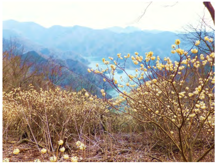
ミツバ岳より丹沢湖